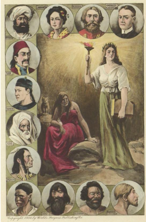
Figura 1. Tipos y desarrollo del hombre