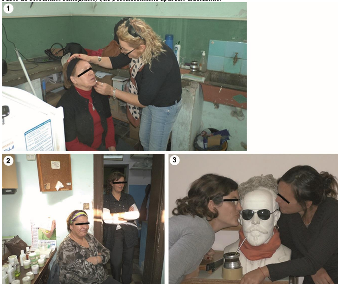
Figura 3. Actividades del personal del MCA en el año 2014, mostrando su desinterés por el trabajo propio de la institución. 3.1: personal de maestranza realizándose faciales en el Depósito de Arqueología; 3.2: misma actividad de la entonces Jefa Interina y otra maestranza; 3.3: dos empleadas administrativas "jugando" con el busto de Florentino Ameghino, que posteriormente apareció fracturado.