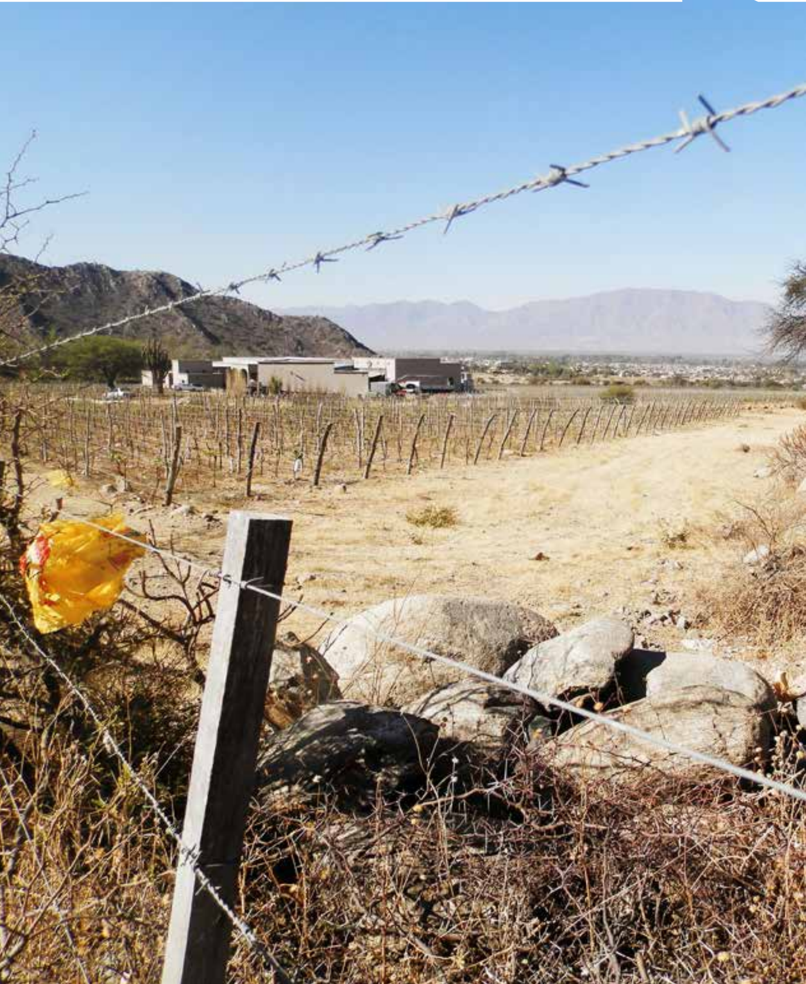
Red Calchaquí. El Divisadero, Cafayate. Estructuras agrícolas prehispánicas y emprendimientos vitivinícolas.