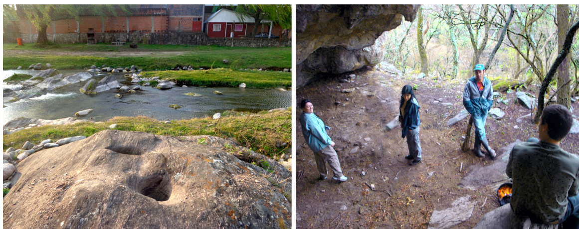
Figura 11: Morteros junto al río en la localidad de Guayamba (izquierda) y sitio Casa Pintada con integrantes del equipo junto con uno de los dueños de campo (derecha).

Nuestra idea es que esta exhibición pueda tener un carácter dinámico que permita incorporaciones y reformulaciones. Por ejemplo, actualmente, se aborda principalmente la temática de Oyola -localidad muy conocida y promocionada-, y la intención es que este eje pueda, luego, virar dando más espacio a lugares y experiencias propias de Guayamba (figura 11), revalorizando lo inmediato que no se encuentra aún incorporado con el mismo peso.