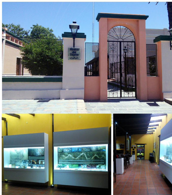
Figura 4: Vista del exterior del Museo de Tapso y de sus salas de exhibición.

En la zona de Tapso las actividades desarrolladas han sido diversas. A fines de 2015 abre sus puertas el “Museo Histórico y Cultural de la Municipalidad de Tapso (figura 4) con el objetivo de preservar y dar a conocer el patrimonio cultural local. Para lograrlo, la municipalidad contó con el asesoramiento de diferentes profesionales 2 . Nuestro equipo estuvo a cargo del diseño y armado de la sala de arqueología, sustentado en las investigaciones propias en el área e implementando recursos audiovisuales (impresiones, gigantografías, videos, textos breves, entre otros) y didácticos (rompecabezas temáticos, estenciles con motivos rupestres, soportes para actividades expresivas). Incluimos también, entrevistas a referentes tradicionales de la comunidad y la exhibición de materiales aportados voluntariamente por vecinos.