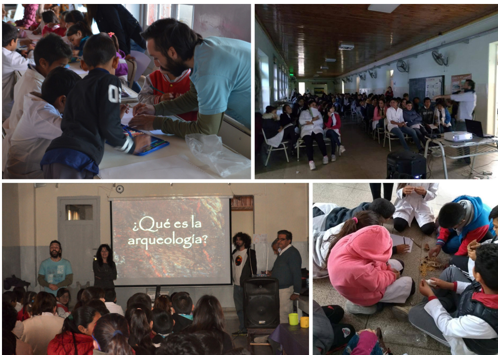
Figura 5: Actividades sobre el patrimonio cultural con la comunidad escolar de Tapso.

Los diversos materiales elaborados para estas actividades, así como libros de divulgación, pasaron luego a formar parte de los recursos del Museo para su potencial uso en las visitas escolares. Los posters (figuras 6 y 7) no solo vinculan gráficamente el presente y pasado local, sino que también incorporan los dibujos realizados por el alumnado de los talleres y hoy forman parte del acervo didáctico de la escuela.