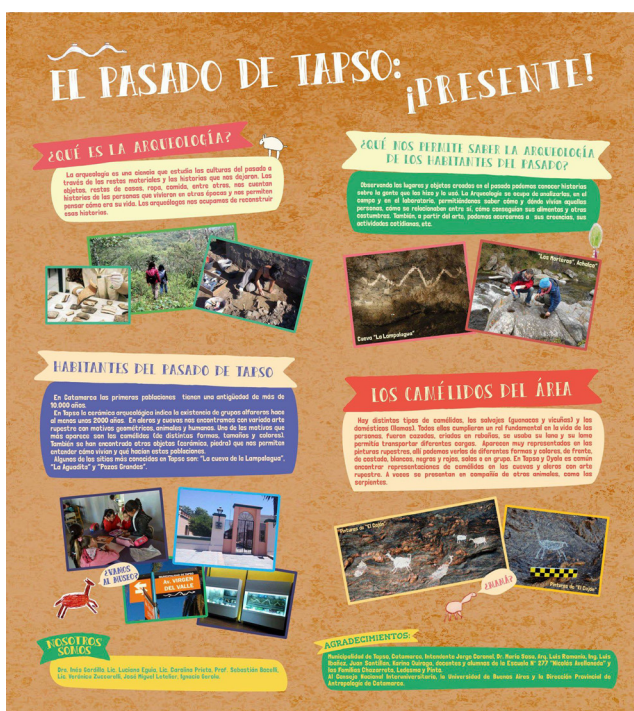
Figura 6: Póster elaborado para la escuela de Tapso.

Los diversos materiales elaborados para estas actividades, así como libros de divulgación, pasaron luego a formar parte de los recursos del Museo para su potencial uso en las visitas escolares. Los posters (figuras 6 y 7) no solo vinculan gráficamente el presente y pasado local, sino que también incorporan los dibujos realizados por el alumnado de los talleres y hoy forman parte del acervo didáctico de la escuela.