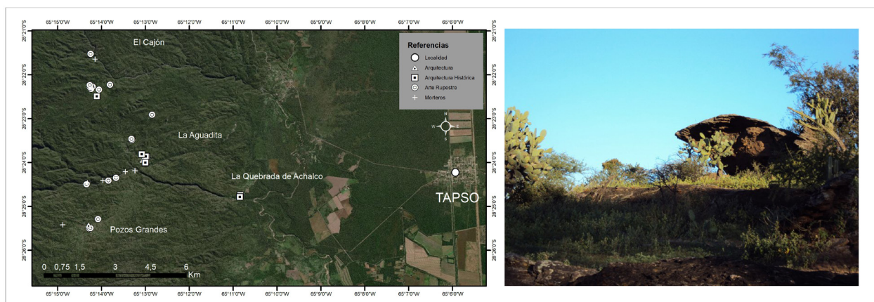
Figura 3: Mapa del área de Tapso con distribución de sitios arqueológicos (izquierda) y foto del ambiente (derecha) (Mapa base: Esri, Maxar, GeoEye, Earthstar Geographics, CNES/Airbus DS, USDA, USGS, AeroGRID, IGN, and the GIS User Community)

Tapso es una localidad que muestra aspectos identitarios que la distinguen de otras regiones; es un espacio de frontera con Santiago del Estero donde, cruzando una vía del tren, hay otra Tapso perteneciente a una provincia distinta. También es el lugar de nacimiento del gobernador de Catamarca Crisanto Gómez (Alaniz 2010), a la vez que posee figuras emblemáticas relacionadas con el turismo religioso que convergen con componentes indígenas prehispánicos. Con el impulso de la intendencia local, se han construido en los últimos años hitos arquitectónicos orientados a posicionarla como un lugar pintoresco y atractivo para turistas y peregrinos, como el Cristo redentor de 10 metros que se yergue en el centro geográfico del pueblo o la réplica de grandes dimensiones de “La Piedad” de Miguel Ángel próxima a la antigua iglesia de Achalco. Paralelamente, se inauguró el museo local y posteriormente se visibilizaron en el paisaje urbano elementos (carteles y murales) alusivos a la historia prehispánica.