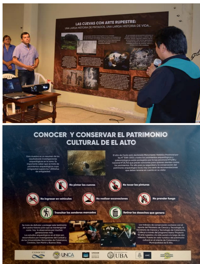
Figura 10: Inauguración de la muestra “El Alto antes de El Alto” (arriba, foto de la Municipalidad) y uno de sus murales sobre preservación del patrimonio (abajo).

Uno de los frutos de este trabajo fue el diseño y montaje de la muestra “El Alto antes de El Alto” (figura 10), inaugurada en febrero de 2020. Consiste en un centro de interpretación, montado en la localidad de Guayamba, donde se narran los diversos modos de realización de las manifestaciones rupestres de la localidad cercana de Oyola. Se profundiza en las experiencias de sus hacedores y visitantes, incorporando reflexiones sobre la vida cotidiana, las viviendas, lugares de cultivo y relación con los vecinos. La muestra contiene también un panel orientado a reforzar las condiciones para proteger el patrimonio y un sector de participación interactiva y lúdica, dedicado a las infancias.