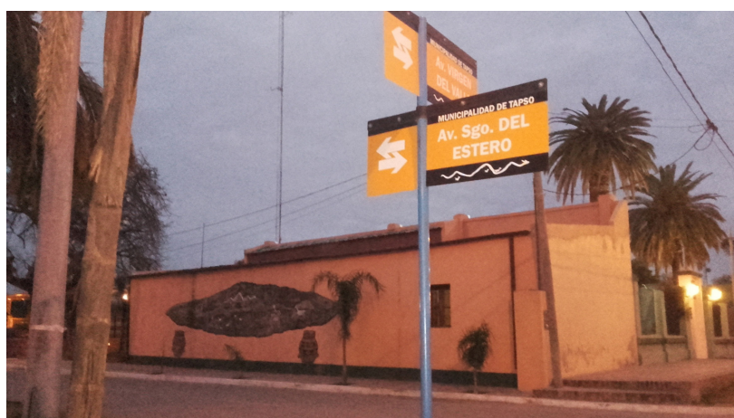
Figura 9: Esquina de Tapso con carteles indicadores de las calles y mural, con la reproducción de La Lampalagua.

Por otra parte, por iniciativa de la municipalidad y comunidad de Tapso los carteles que llevan el nombre de las calles contienen la figura de la Lampalagua, una representación precolombina que domina el interior de una de las cuevas. La misma se repite en cada esquina, así como en un mural callejero de grandes dimensiones en el centro del poblado, donde aparece junto a otras reproducciones del arte rupestre local (Figura 9). De esta manera, tales íconos adquieren valor en el paisaje tapseño actual como elementos identitarios de la comunidad.