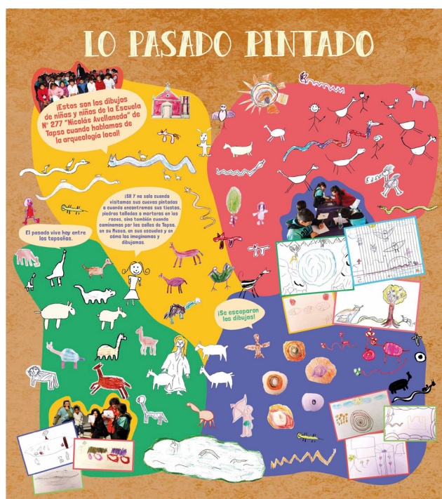
Figura 7: Póster basado en los dibujos de las niñas y niños realizados durante las actividades en la escuela de Tapso.