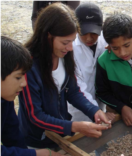
Figura 4. Rincón Chico 18, Catamarca, visitas guiadas en la excavación arqueológica brindada a alumnos de escuelas primarias de Santa María. Marzo de 2008.

ahí en adelante y dejó su huella en punzantes charlas de madrugada en mesas de bares y campings.