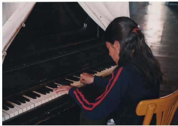
Figura 3. Centro Obrero, bar y restaurante en el cual se cenaba durante las campañas en el valle de Santa María. Mayo 2004.

Además de las localidades arqueológicas mencionadas, participó en trabajos de campo en otros sitios de Yocavil como Medanitos, El Calvario de Fuerte Quemado y Soria 2. Dirigió relevamientos planimétricos y arquitectónicos, intervino en excavaciones y puso su hombro cada vez que había que ganarle al reloj de los días de fin de campaña.