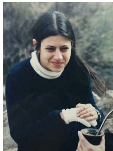
Figura 1. Campaña en Rincón del Toro, La Rioja. Agosto, ca. 2000.

Ordenemos un poco el relato. Marina completó su formación escolar y universitaria en instituciones públicas: cursó sus estudios primarios en la Escuela N° 21 "General José de San Martín" de Bernal —su barrio de toda la vida— y los secundarios en la Escuela Nacional Normal de Quilmes, localidad en la que nació. Inició la carrera de Ciencias