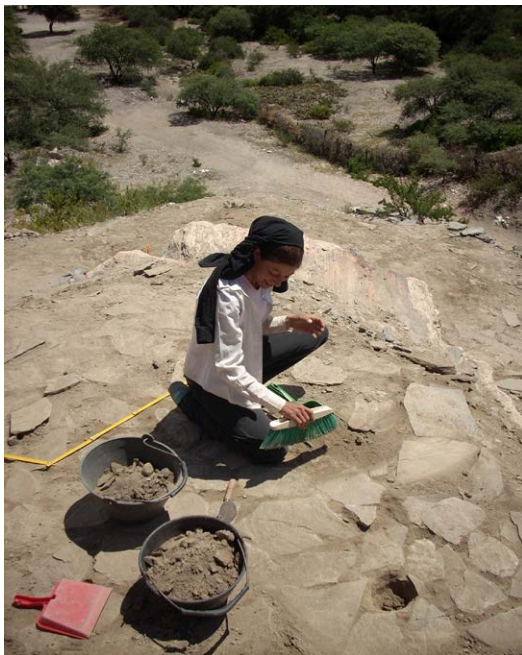
Figura 2. El Calvario de Fuerte Quemado, Catamarca, excavación del Torreón Medio. Marzo-abril de 2008.