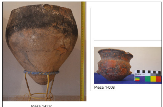
Detalle del contexto funerario re-armado n° 3 de la Colección Pereira proveniente de la Loma de los Antiguos

Con referencia al conjunto cerámico, destacamos la diversidad de piezas completas o parcialmente enteras (95:131) sobre el fragmentario (tiestos) (36:131). Las primeras por sus diseños morfológicos y visuales responden a las sociedades agro-pastoriles que habitaron la región tanto en el primer milenio de la era como en momentos Tardíos contemporáneos con la presencia incaica en la región. Cuatro contextos funerarios pudieron ser re-armados sobre la base de la memoria oral de Osvaldo Pereira, los cuales provienen de la Loma de Los Antiguos (Contextos N° 1, 2 y 3, Figuras 4, 5 y 6, respectivamente) y de El Sunchal (Contexto N° 4, Figura 7). Los dos primeros (N° 1 y N° 2) pudieron ser datados y remontan al siglo XIV (Basile y Ratto 2016).