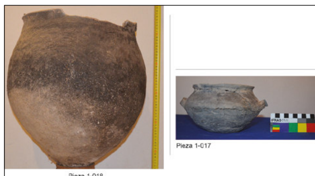
Detalle del contexto funerario re-armado n° 4 de la Colección Pereira proveniente del El Sunchal

Dentro de este conjunto destaca la presencia de 663 puntas líticas, las que, en su mayoría, 95%, son de tamaño pequeño, de obsidiana o rocas volcánicas básicas, con pedúnculo y aletas entrantes y apedunculadas de base concavilínea. Estos diseños remiten a las sociedades tardías-contacto incaico y provienen mayormente de las áreas de El Barreal (Figura 2).