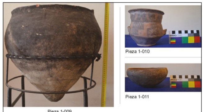
Detalle del contexto funerario re-armado n° 2 de la Colección Pereira proveniente de la Loma de los Antiguos

Tal como adelantamos, la Colección está compuesta por 1337 artefactos arqueológicos de distintas clases y tipos de objetos, con frecuencias variables, donde el conjunto lítico supera ampliamente a los otros, incluido el cerámico. Así, destacan materiales arqueológicos de distintas clases: (i) alfarería (9,80%): piezas cerámicas completas y fragmentadas, torteros, figurinas, pipas y fichas de juego; (ii) lítico (85,64%): puntas de proyectil, hachas, boleadoras, núcleos, torteros, artefactos de molienda, cuentas de collar, adornos, e instrumentos y preformas de instrumentos diversos; (iii) metal (1,57%): agujas, pinzas y adornos; (iv) óseo (0,75%): instrumentos; (v) madera (0,15%): cuenta y peine, y (vi) malacológico (2,09%): adornos.