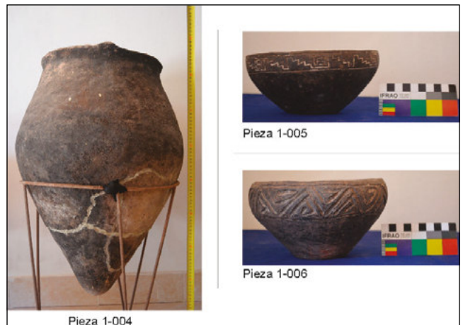
Detalle del contexto funerario re-armado n° 1 de la Colección Pereira proveniente de la Loma de los Antiguos

Poster entregado a la familia Pereira, que da cuenta de los materiales y actividades realizadas durante el relevamiento de la Colección