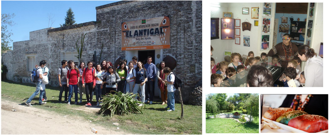
Figura 2. Centro de Interpretación Indígena “El Antigal”: talleres interculturales (arriba y a la derecha); espacio ceremonial y “pan de colores” para la merienda con productos indígenas.

Esta trama, nos explica la cacica, incluye la voz de los indígenas a la par con la de ciertos investigadores, ya que no todos los “ologos” están dispuestos a trabajar en un marco de respeto y consenso (Romero 2009, 2016). Aclaración que nos remite a una serie de tensiones que han tenido lugar en la gestión de los materiales arqueológicos referidos a la historia indígena cuyos avances en los marcos legales no siempre se correlaciona en situaciones concretas. Al respecto, cabe destacar que son muy escasos los espacios institucionales donde la definición y el manejo de los materiales arqueológicos es completamente controlado por miembros de comunidades indígenas. Esta falta de control de las instituciones que gestionan el patrimonio arqueológico indígena es la base para reproducir “uno de los mecanismos centrales del multiculturalismo de Estado, la participación sin participación” (Gnecco y Ayala Rocabado 2010: 24). En este contexto, el caso que aquí se presenta ofrece un contraejemplo exitoso cuya base es la gestión que desarrollan los miembros de la comu-