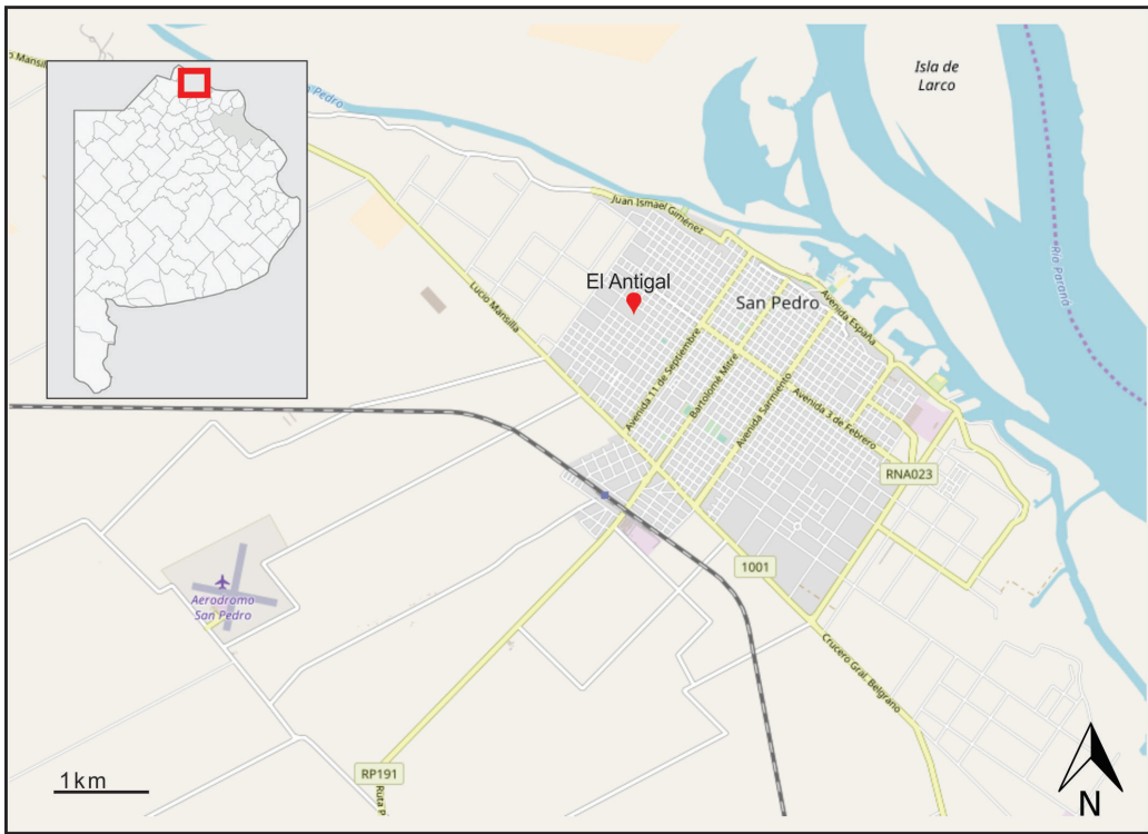
Figura 1. Mapa de la localidad de San Pedro con la ubicación de “El Antigal”. Elaboración propia en base a openstreetmap.org

temporáneos-; un salón con instalaciones para llevar a cabo diversas actividades (encuentros y foros con otras comunidades indígenas y con investigadores; talleres interculturales con escuelas de la localidad, entre otros); y un terreno en el que se ubica el sitio ceremonial. “El Antigal” es sede de actividades de educación intercultural que realiza la comunidad con instituciones escolares (Romero et al. 2016); es espacio de intercambio y aprendizaje entre investigadores e indígenas; es un punto de encuentro entre comunidades; es un lugar de y para los antiguos, es ámbito de resguardo y conservación de elementos indígenas. Como colaboradores y miembros del equi-