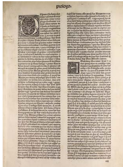
Gráfico 3. Edición de 1555 de las Siete Partidas, glosadas por Gregorio López. Edición a cargo de Andrea Portonaris, impresor real (Fuente: Fondo Reservado de la Biblioteca "Samuel Ramos", Facultad de Filosofía y Letras, UNAM).